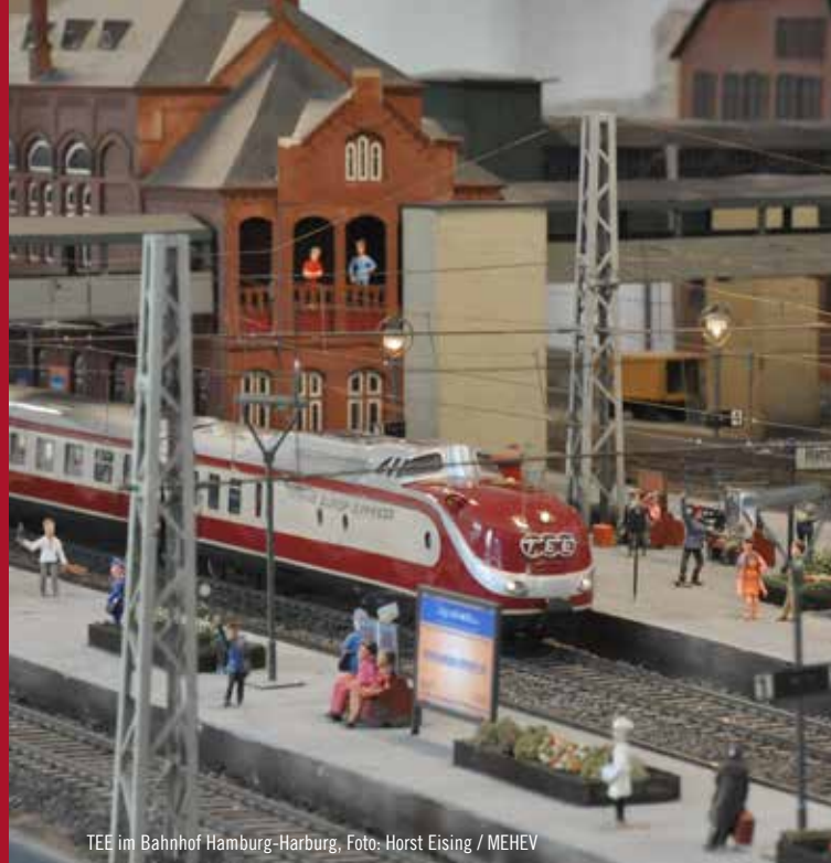
TEE im Bahnhof Hamburg-Harburg, Foto: Horst Eising / MEHEV

Bei Vorlage der Eintrittskarte vom Miniaturwunderland oder vom Hamburg Museum erhalten Besucher im Zeitraum von 30 Tagen einen einmaligen ermäßigten Eintritt im Partnermuseum.