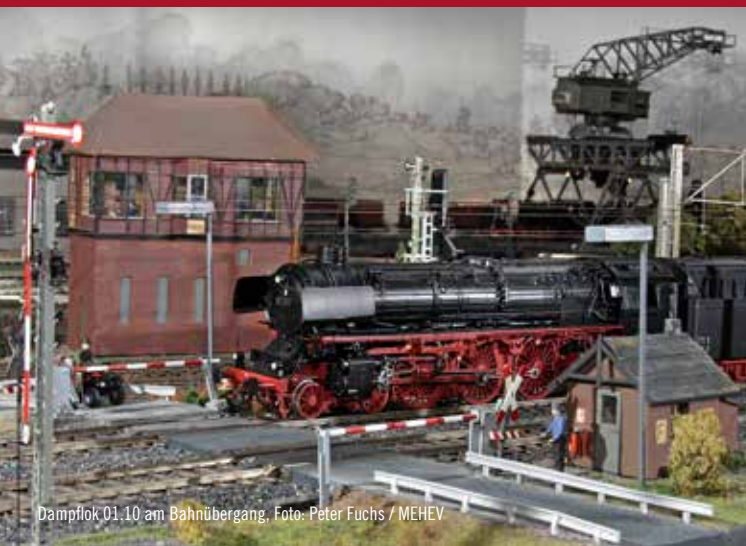
Dampflok 01.10 am Bahnübergang, Foto: Peter Fuchs / MEHEV