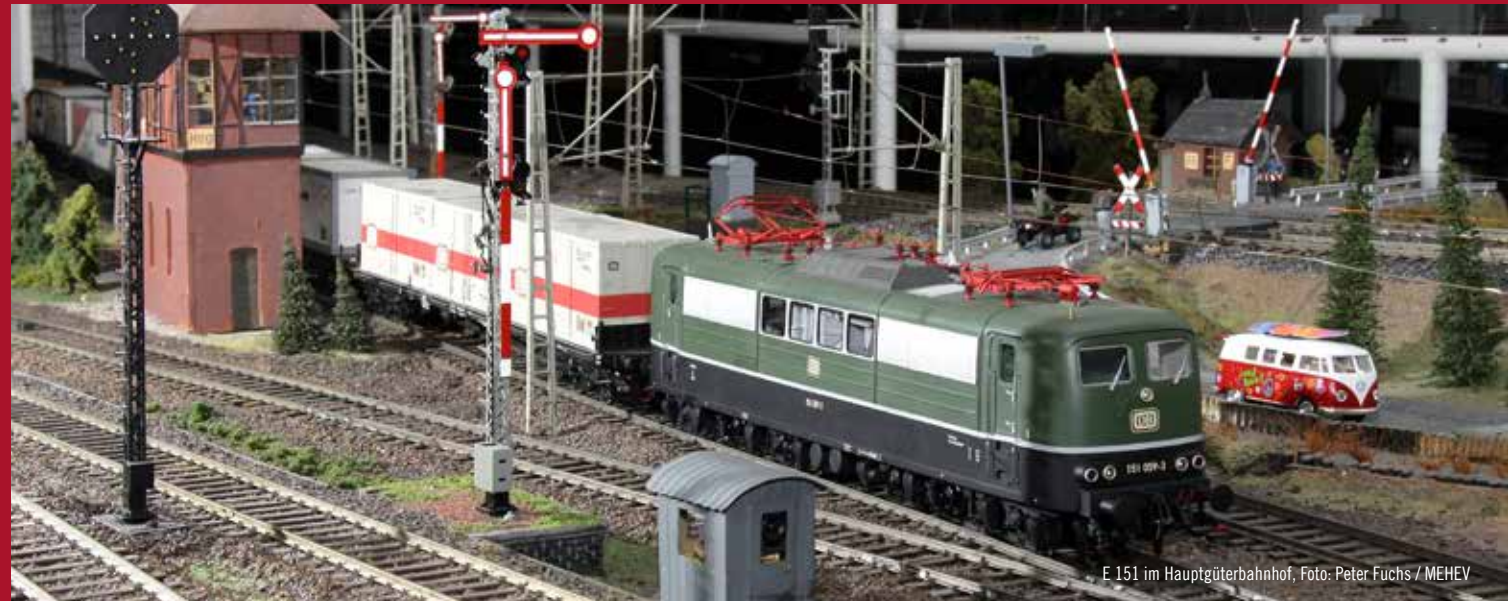
E 151 im Hauptgüterbahnhof